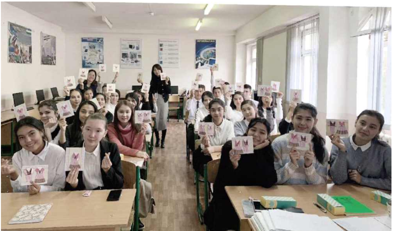
[乌兹别克斯坦当地韩语特讲]